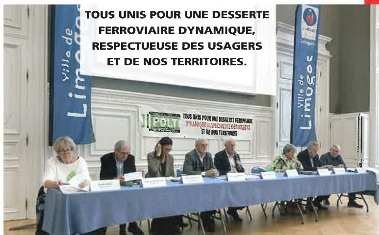
AG, 12 octobre 2024, Hôtel de Ville de Limoges.